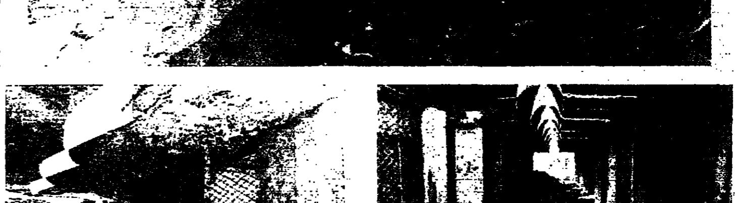
محاولة الحلات التجارية المارحة لصحة التعمير إلى مستودعات لرمي النفايات

في صيدا القديمة تتحول إلى مستودعات للدوساخ